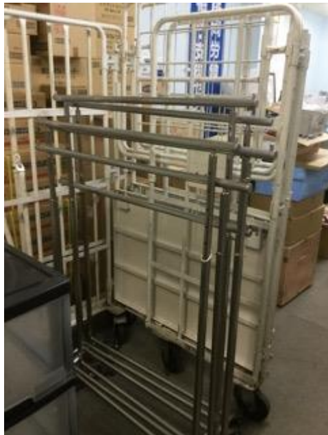
フードバンク団体へ什器を提供