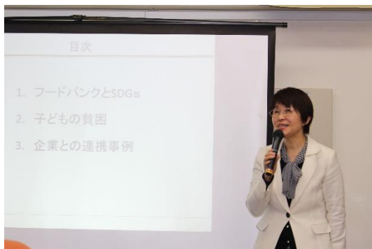
フードバンク団体と企業との連携事例の説明