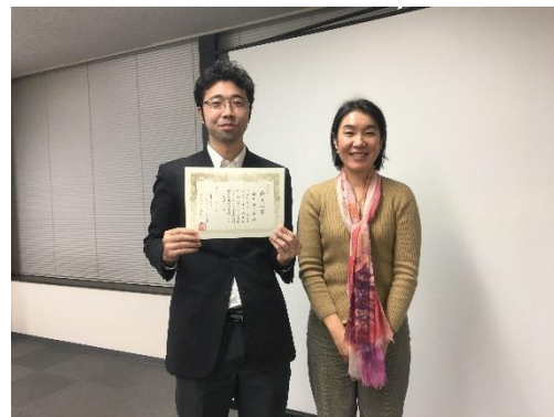
コンサルタント養成講座修了