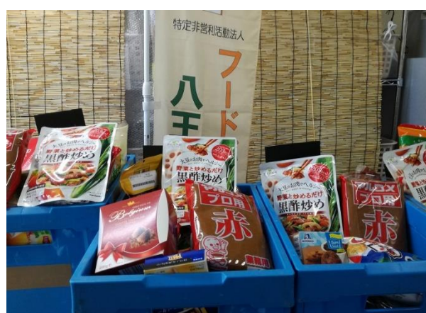
フードバンク団体への食品提供