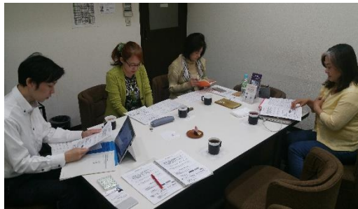
フードバンク団体への基盤強化支援 (第2回目団体訪問)