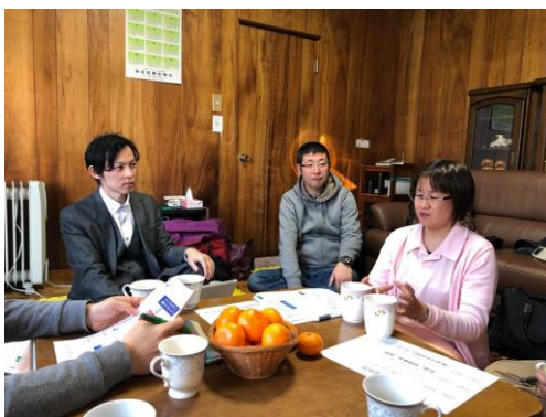
コンサルタント養成講座実地研