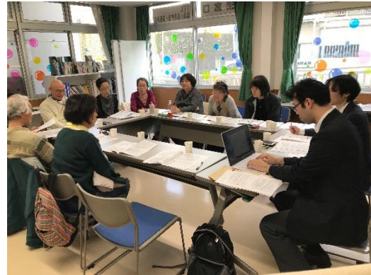
フードバンク団体への基盤強化支援 (第一回目団体訪問)