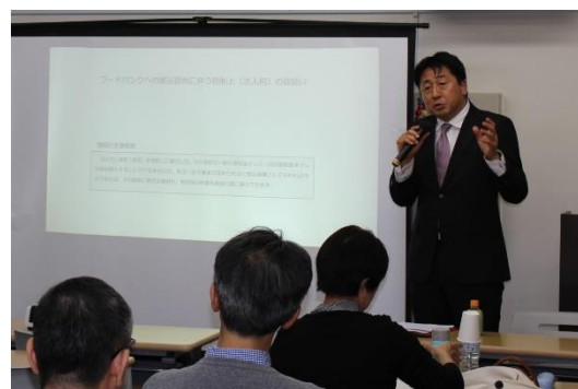
フードバンクへの食品寄贈に係る支援税制の説明