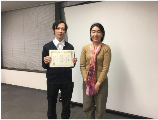
コンサルタント養成講座修了