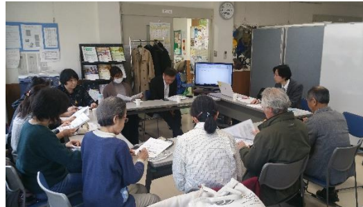
フードバンク団体への基盤強化支援 (第2回目団体訪問)