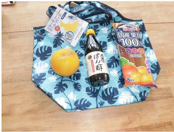
フードバンク団体へ保冷バックを提供