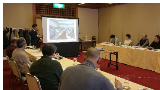
直接訪問によるノウハウ支援