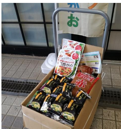
フードバンク団体への食品提供