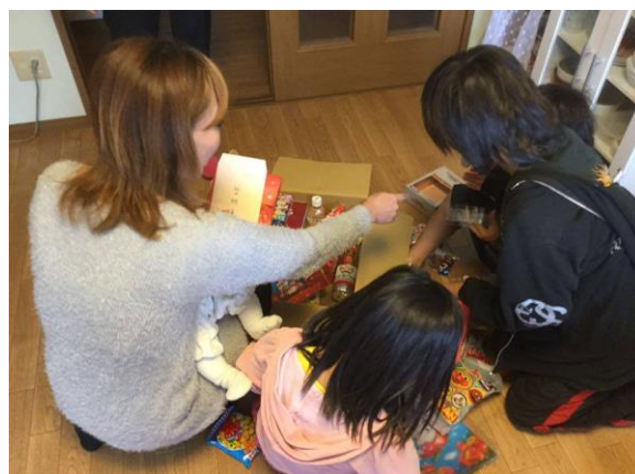
食品支援先の家庭