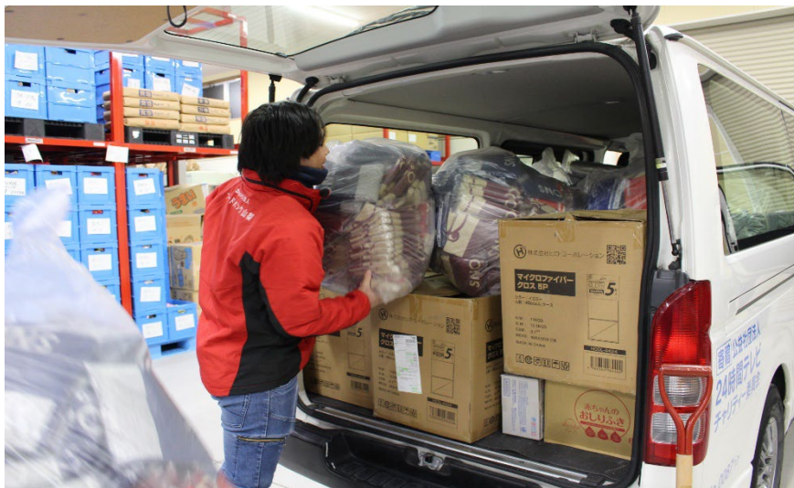
加盟団体による緊急支援活動の様子

全国フードバンク推進協議会では、1月2日から関係者が被災地域に入り、自治体や被災地域のフードバンク団体等と連携し支援ニーズの把握等初動対応に取り組みましたが、被災状況の大きさから長期的な支援が必要になることや現場からの支援ニーズに基づき緊急支援活動を開始しました。